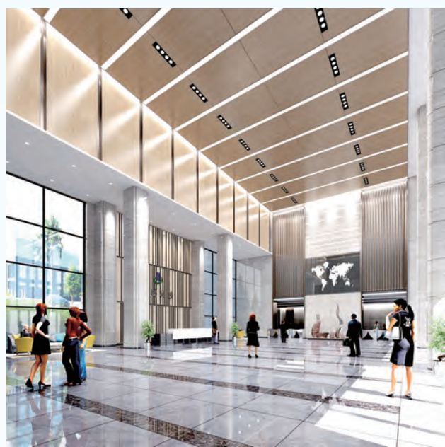
华成科技主楼1F大堂效果图（实际解释权归传代科创所有）