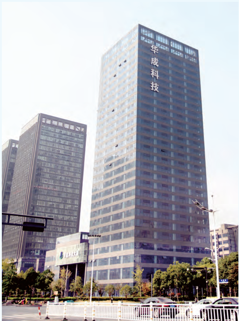
华成科技大厦实景图

1985创业园运营后，预计将有大量的新增税收、新增就业岗位产生；集聚一大批工商户、中小企业、加快形成新业态；接待大量考察团，带动周边人气，提升经济水平；加快城市经济转型升级、推进创新创业；为当地传统企业转型提供良好契机；构建城市创新创业生态圈，激活萧山创新活力创业动力。